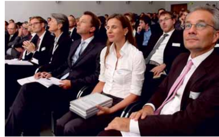
Die Preisverleihung des 24. Schweizer Geschäftsberichte-Ratings fand zum dritten Mal im Vortragssaal der Zürcher Hochschule der Künste statt.